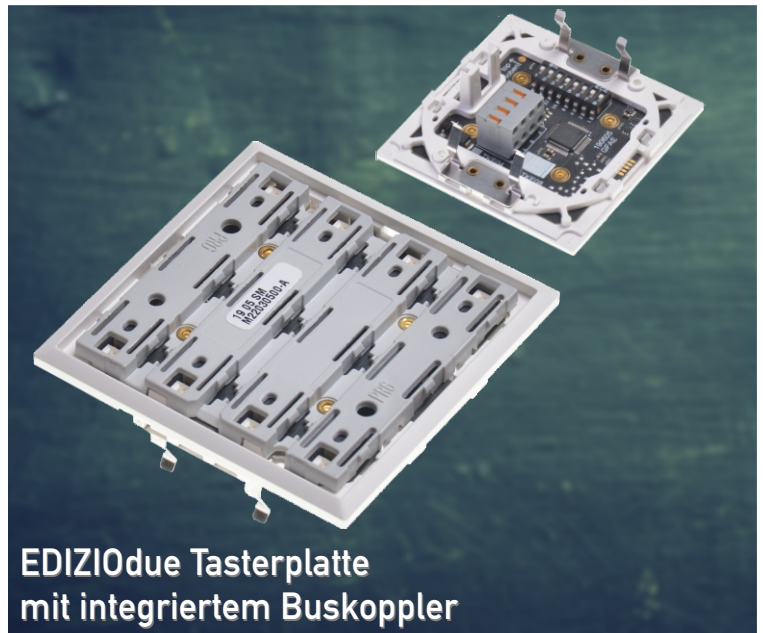
EDIZIOdue Tasterplatte mit integriertem Buskoppler